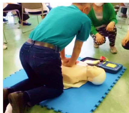
※写真はAEDの使用法を学んでいます。